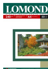
Glossy 240 g/m 2 A4/ 50 листа