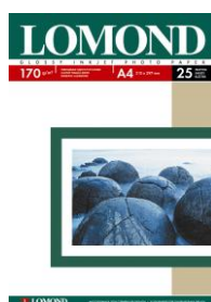
Glossy 170 g/m 2 A4/ 25 листа A4/ 50 листа